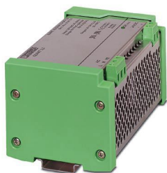
Voeding, primair geschakeld, ingang 230 V AC, uitgang 24 V DC/2,5 A

Let erop dat de in dit pdf-document weergegeven gegevens uit onze online catalogus zijn gegenereerd. De volledige gegevens treft u aan in de gebruikersdocumentatie. Onze Algemene gebruiksvoorwaarden voor downloads zijn van kracht